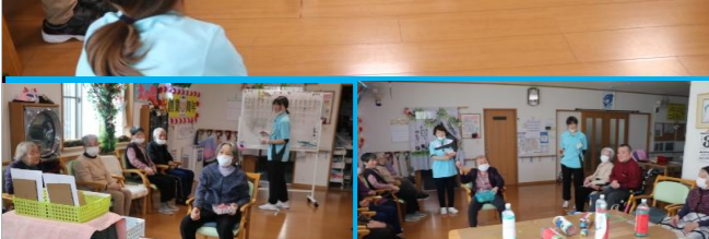
優勝めざし！毎日！楽しく！和気あいあい！と