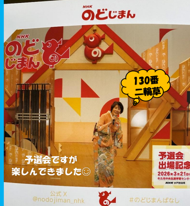
予選会ですが 楽しんできました😊